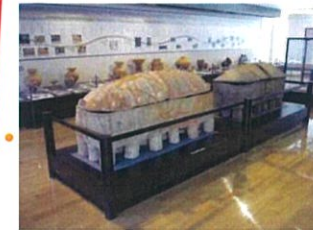
岡山市御津郷土歴史資料館 (常設展示室)