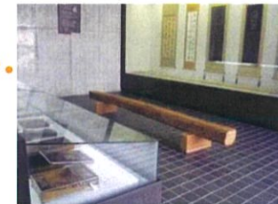
栢菅コレクション展示室

大人や子どもたちが生き生きと 暮らしを楽しみ、ときめきのある 元気な地域になるためのプラザです。